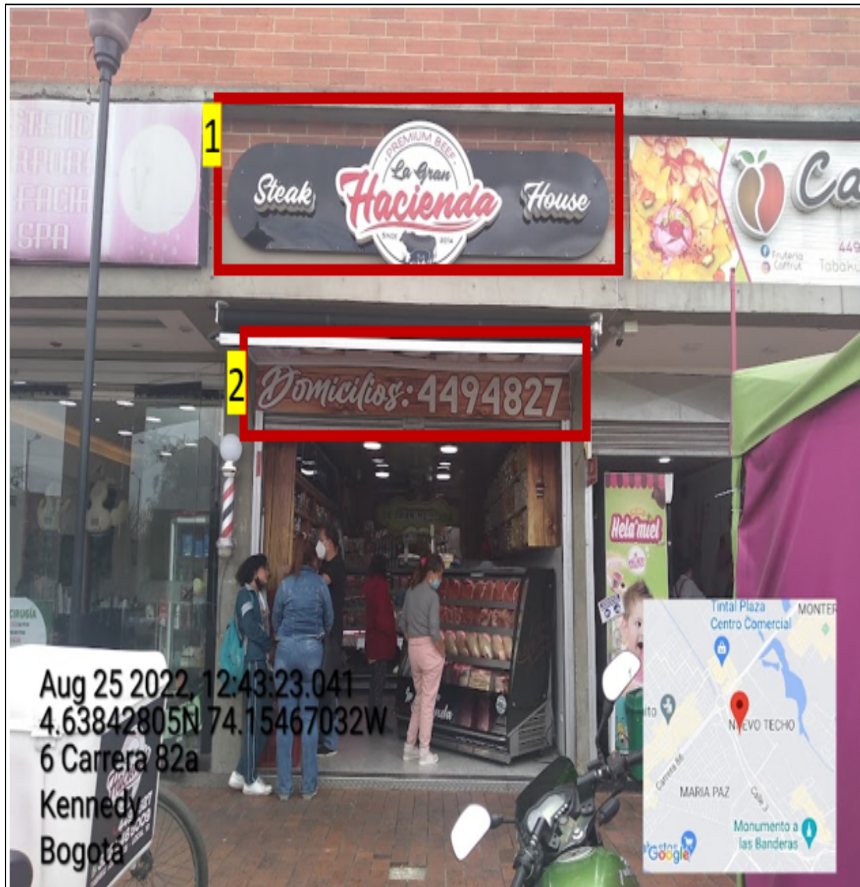
Vista panorámica del predio en el que se sitúa el establecimiento comercial demoniado AVÍCOLA Y SALSAMENTARÍA LA GRAN HACIENDA , en la que se puede evidenciar: un (1) elemento publicitario tipo “aviso en fachada” instalado sin contar con el registro ante la Secretaría Distrital de Ambiente, identificado con el número 1. De igual forma se observa, un (1) elemento publicitario adicional con relación al único permitido por fachada de establecimiento identificado con el número 2.